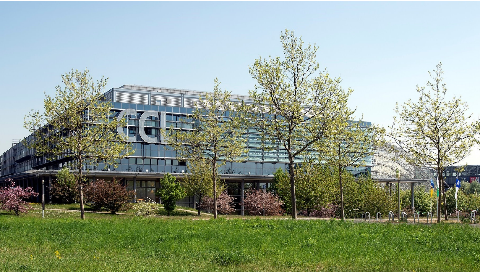
Congress Center Leipzig (CCL) auf dem Gelände der Leipziger Messe